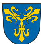
VG Massing, Landkreis Rottal-Inn