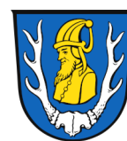
Gemeinde Traitsching, Landkreis Cham