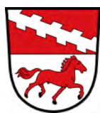
Gemeinde Eggldham, Landkreis Rottal-Inn

Hier finden Sie eine kleine Auswahl unserer Referenzen: