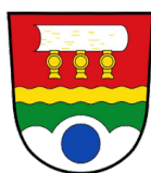
Gemeinde Neureichenau, Landkreis Freyung-Grafenau